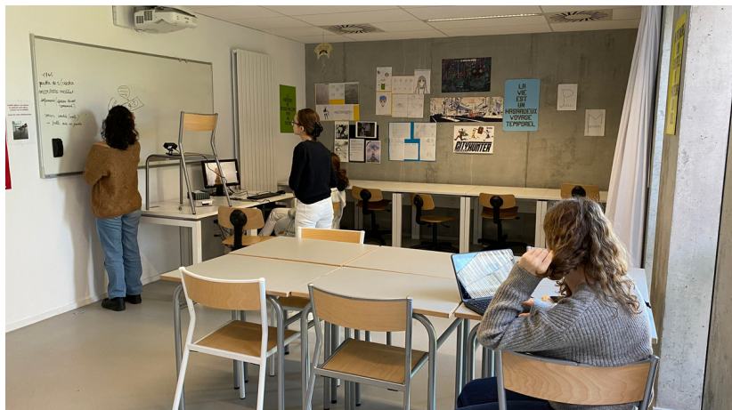
La réalisation des illustrations au CDI du lycée.

Tous les participants au concours ont participé aux enregistrements, à l'exception de Yann, qui ne pouvait pas être présent au moment des prises de son, mais qui a réalisé tous les montages vidéo/audio.